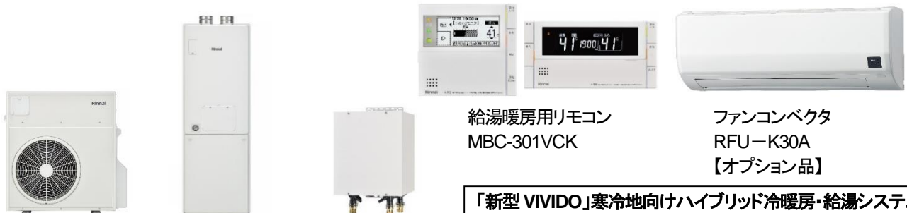
ヒートポンプユニット RHP-R87 ガス給湯暖房熱源機 RHBH-RM246AFF2-1 熱交換ユニット RNKU-2314

また、北海道エア・ウォーターでは、「VIVIDO」を使用されるお客様向けに割安な LP ガス料金プランを展開しています。今後は、2021年4月の販売開始に向けて、新築住宅への導入やオール電化からの切り替えを検討されているお客様を中心に、提案を進めてまいります。