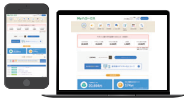
Myハローガスでご請求書を いつでもご確認いただけます