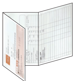
紙によるご請求書

郵送による紙のご請求書の送付を取りやめ、WEB上のハローガスのお客さま専用マイページ Myハローガスよりスマートフォン、パソコンでご請求内容をご確認いただくサービスです。